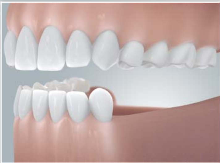
Freundsituation (verkürzte Zahnreihe)