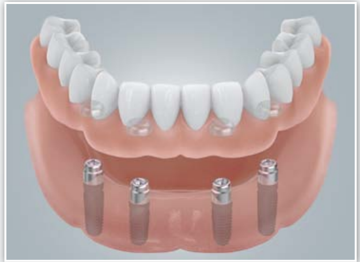
Befestigung mit Druckknöpfen (Locatoren)